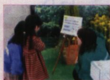
“3.11 from KANSAI” 家族写真 撮影会