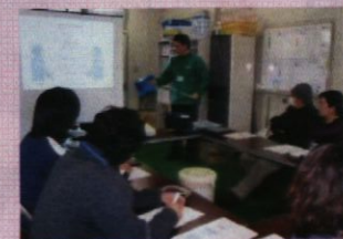
宮城・福島県 くすりの豆知識 勉強会 手洗い講習会