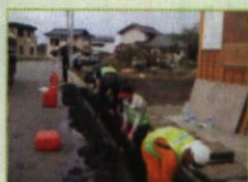
陸前高田市 がれき片付け ボランティア