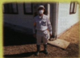
除染ボランティア