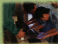
気仙沼市立大島小・中学校 くすりの授業、手洗い講習会