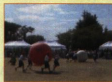
大熊町立 幼・小・中学校 合同運動会