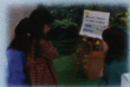
県外への避難住民を対象とした 復興イベントへの参加