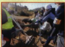
除染ボランティア