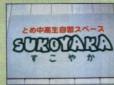
宮城県登米市 中高生向け軽食つき自習スペース "SUKOYAKA"