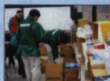
宮城県薬剤師会 薬剤師 ボランティア