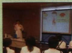
岩手県大船渡市 全中学2年生を対象とした 職業体験学習支援