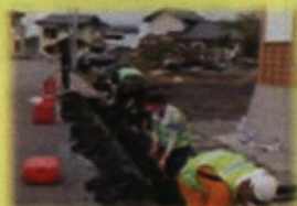
岩手県陸前高田市 ボランティアバス派遣