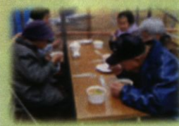
気仙沼 大島仮設住宅 芋煮会、手洗い講習会