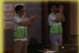
ドリームケアチーム