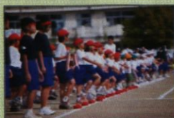
福島県大熊町運動会 開催支援