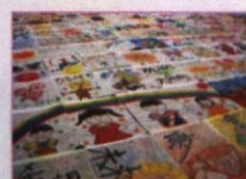
福島県 大熊町 運動会応援フラッグ