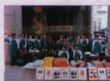
“東北応援マルシェ” 特産品・福祉授産施設製品 物産展

*登米市には、被災した南三陸町の方々の多くが避難しています。狭小な仮設住宅では子ども達が学習する場所がないため、放課後を安全に過ごせる施設が求められていました。