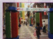
“仙台七夕祭” 折鶴プロジェクト