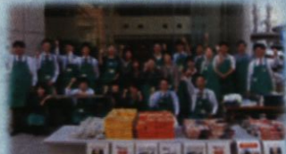
主要事業所における 『東北応援マルシェ』の開催