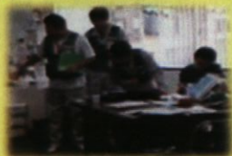
薬剤師ボランティア