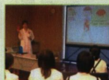
大船渡市 全中学2年生 職場体験学習