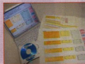
福島県災害 ボランティアセンター IT支援